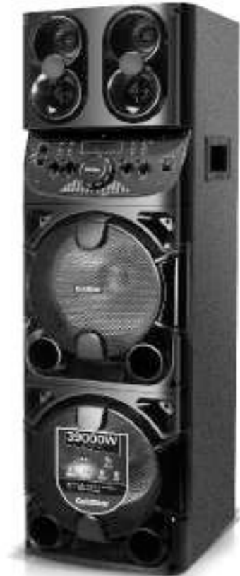
IMÁGENES A MODO ILUSTRATIVO